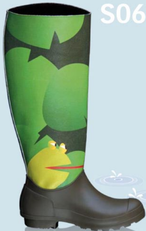
S06 Ranocchio Grenouille Frog

Stivali in pelle sintetica stampata, idrorepellente, morbida (84% PVC 16 % Poliestere 750g/mq \pm 5%). Interno degli stivali e galoscia in morbida plastica foderati in tessuto sintetico. Numerazione dal 36 al 41. Cuciti rigorosamente a mano con pazienza e abilità artigiana. Stivali realizzati interamente in Italia. Si possono personalizzare con decori, disegni, pensieri. 100% MADE IN ITALY.