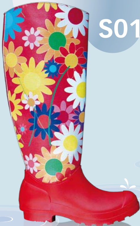
S01 Margherite Marguerites Daisies