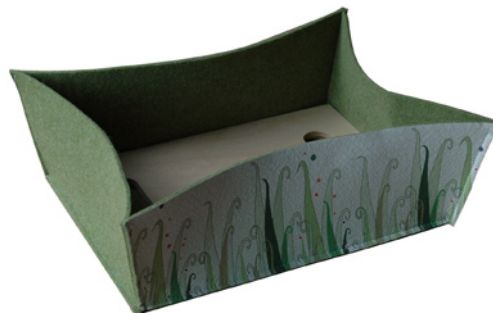
Vassoio in feltro di lana e legno Dimensioni: 33 x 23 cm.