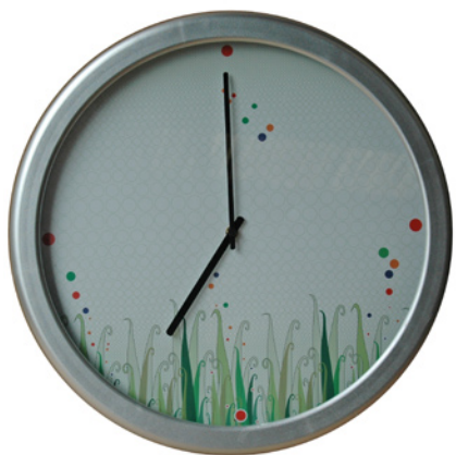
Orologio Ø 50 cm.