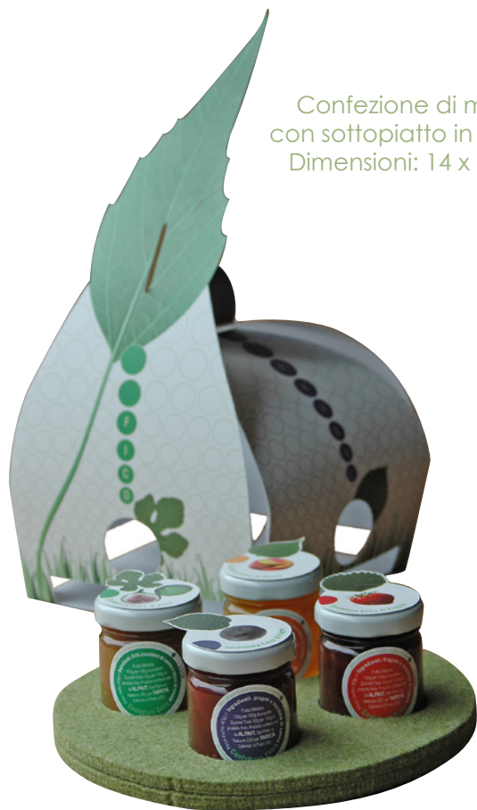
Confezione di marmellate con sottopiatto in feltro di lana Dimensioni: 14 x 14 x 17 cm.