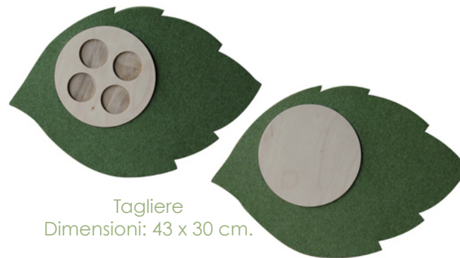
Tagliere Dimensioni: 43 x 30 cm.