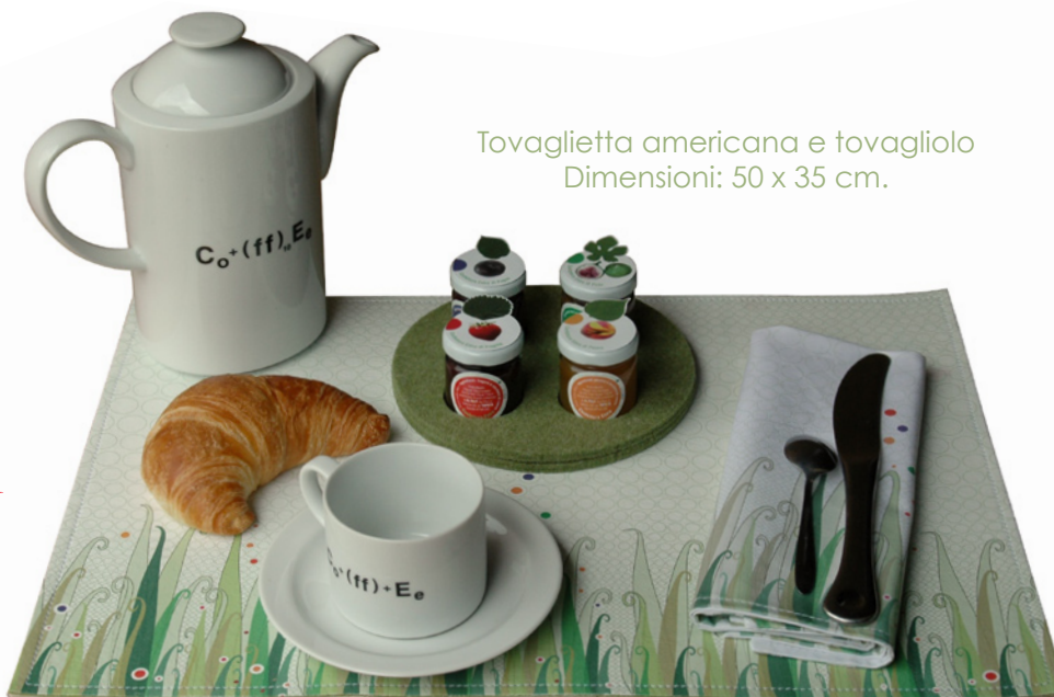
Tovaglietta americana e tovagliolo Dimensioni: 50 x 35 cm.