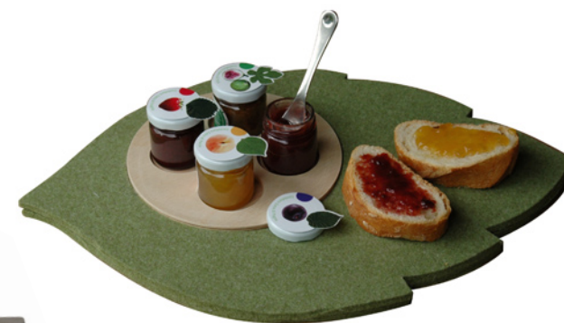
Tagliere in feltro di lana e faggio Dimensioni: 43 x 30 cm.