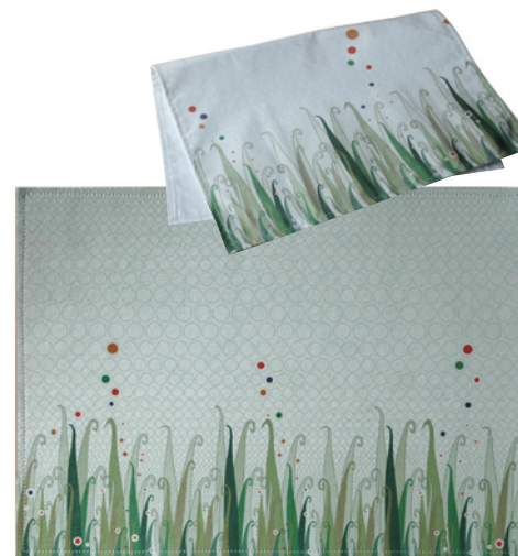
Tovaglietta americana e tovagliolo Dimensioni: 50 x 35 cm.