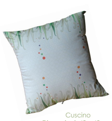
Cuscino Dimensioni: 40 x 40 cm.