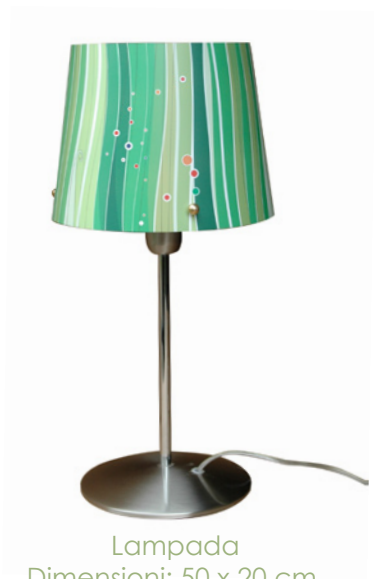
Lampada Dimensioni: 50 x 20 cm.